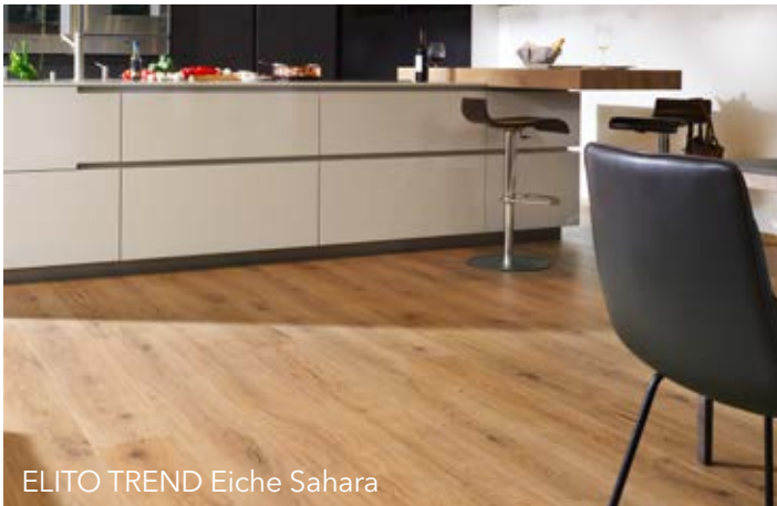
ELITO TREND Eiche Sahara

Mehr Infos zu unseren Vinylböden und unseren Designkatalog zum Download finden Sie hier: